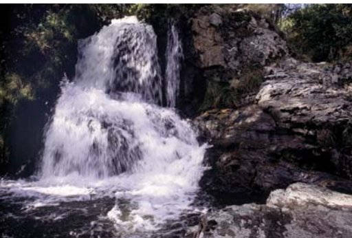
Cascade de Jassy