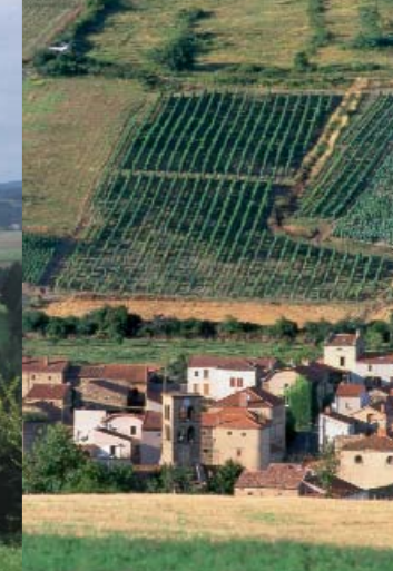
A Boudes la vigne a reconquis les pentes du plateau de la chaux.