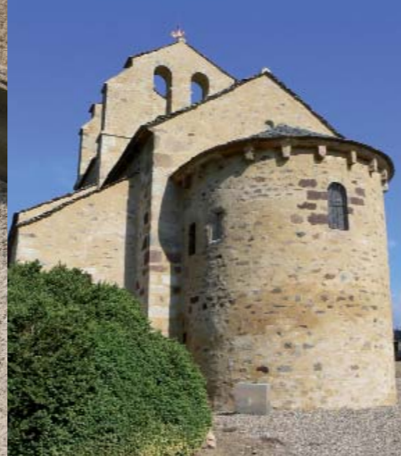
La chapelle romane de Saint-Hérent jouxtait un ancien château disparu. Sa sobriété extérieure cache un élégant décor intérieur.