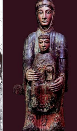
Frontalité et solennité prime dans cette représentation de la Vierge en Majesté de Colamine-sous-Vodable.