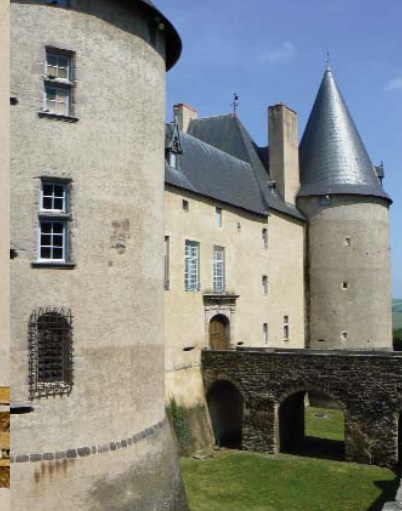
A l'issue d'une brillante carrière auprès des rois de France, Rigault d'Aureille se retira dans son nouveau château de Villeneuve.