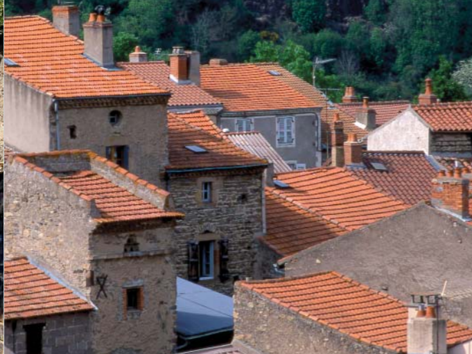
Ambiance caractéristique des villages resserrés des vallées des couzes. Les maisons étroites à étages se distinguent à peine du pigeonnier aux murs surélevés.