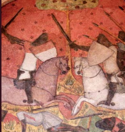
Le combat de Palamède sur une des scènes des peintures murales du 15 e siècle de Saint-Floret.