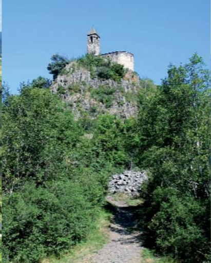
A Saurier, la chapelle de Brionnet prolonge la silhouette d'un très ancien volcan.