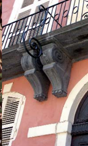
Le jeu des couleurs met en valeur cette façade de la place de la République à Issoire.