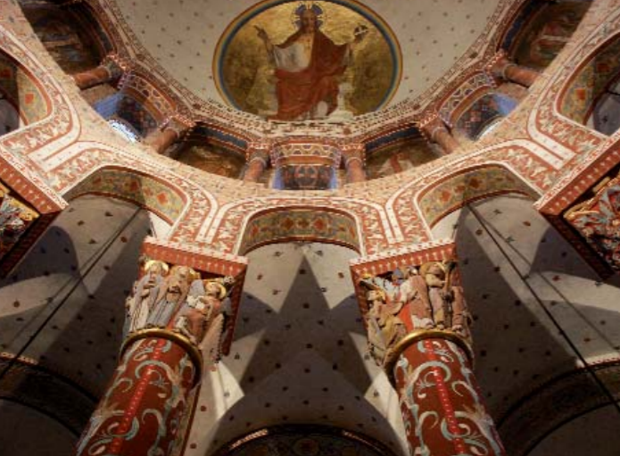
A l'abbatiale Saint-Austremoine d'Issoire les regards sont guidés vers le chœur, les chapiteaux du rond-point et le décor peint composé au 19 e siècle par Anatole Dauvergne.

La sculpture se concentre sur les chapiteaux, le portail et les modillons. De la ville aux montagnes, traditions savantes et profanes inspirent diversement les sculpteurs. A Issoire l'influence biblique s'exprime clairement sur les chapiteaux historiés du chœur avec la Passion du Christ. Dans la nef, modèles antiques et morale ambivalente du bestiaire roman cohabitent au milieu d'un univers végétal. A Mailhat ces influences se conjuguent pour créer un riche décor. Enfin d'Orsonnette à La Godivelle, d'énigmatiques figures envahissent en toute liberté les corniches.