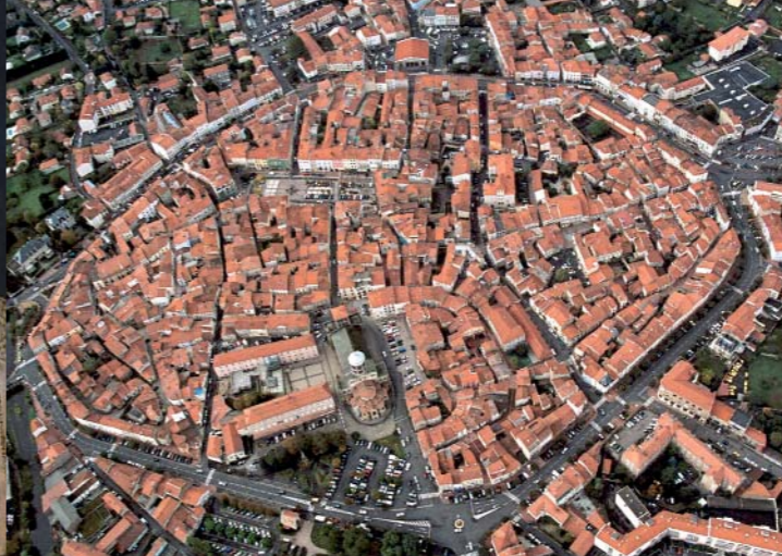
L'ovale des actuels boulevards d'Issoire évoque le tracé des fortifications qui protégeaient la cité médiévale.