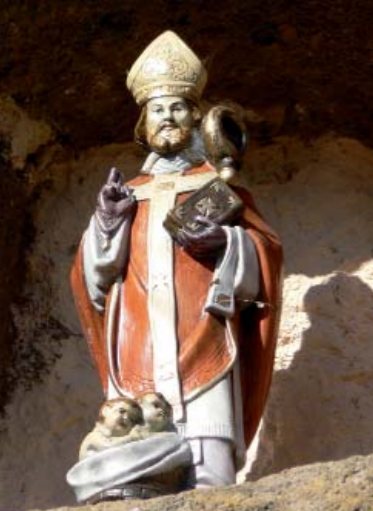
Saint-Nicolas, patron des marins de l'Allier, à Brassac.