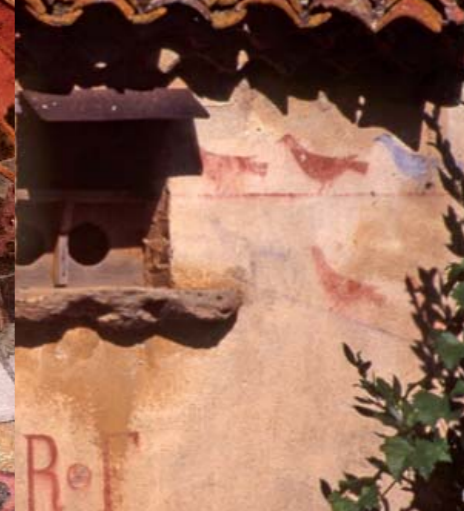
Ce pigeonnier du Lembron conserve un décor peint symétrique encadrant l'accès aux nichoirs.