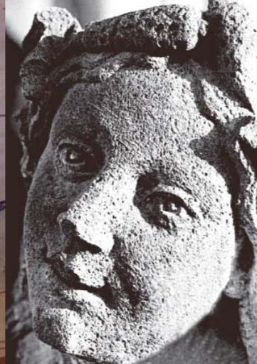
La pierre de Volvic se prête à des jeux d'ombre et de lumière sur le visage d'une sirène de la fontaine aux Lions de Plauzat.