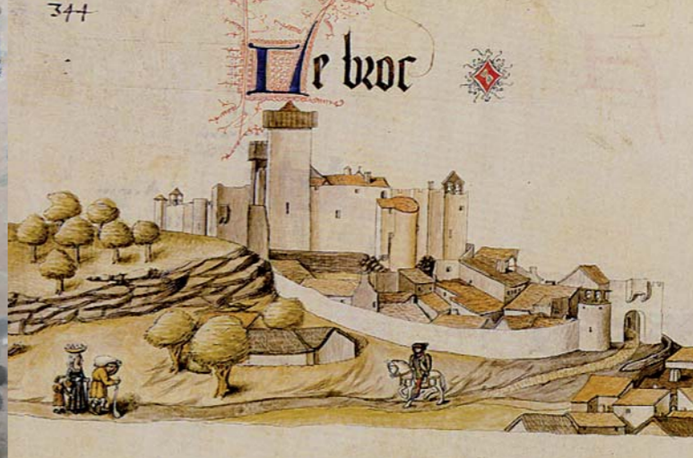
Vers 1450, le château et le village du Broc sont représentés dans l'Armorial de Revel, ainsi que quelques habitants ...