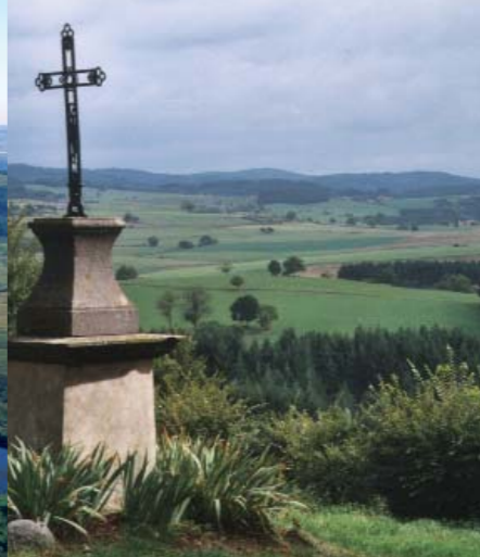
La croix de La Chapelle-sur-Usson domine les doux plateaux du Livradois.