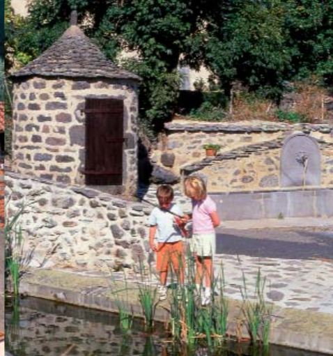
Le plus bel ensemble de petit patrimoine dédié à l'eau se situe à Ternant-les-Eaux.