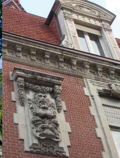
Cette façade de style éclectique fut réalisée en 1883 pour la Caisse d'Epargne d'Issoire.