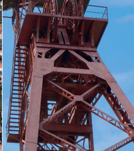
A La Combelle, le chevalement métallique du puits des Graves a été remis en état en 2002 pour témoigner de l'histoire du bassin minier.