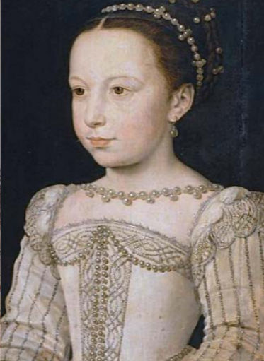
Marguerite de Valois, plus connue sous son surnom de Reine Margot, fut comtesse d'Auvergne et vécut à Usson de 1586 à 1601.