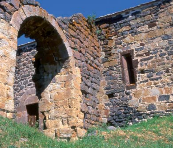
Chaque pierre de l'ancien château du Fromental de Rentières raconte une histoire, mais ici la polychromie répond plus à des nécessités de construction que de décor.

Les théologiens du Moyen âge associent la couleur à la lumière divine et dans la pratique médiévale, le décor peint achève la construction de l'église. Ancien et nouveau Testaments, Vies des saints inspirent en priorité les figurations. A Champeix, l'église Saint-Jean renferme quelques fragments du banquet d'Hérode. Aux 14 e et 15 e siècles, le thème de la mort se devine dans la peinture votive de l'église du Chastel à Saint-Floret et prédomine à Issoire dans la représentation du Jugement dernier, un des thèmes favoris du Moyen âge.