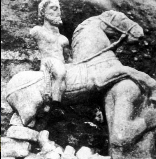
Dans cette statue du 2 e siècle après J.C., découverte à Neschers en 1939, le cavalier personifie la divinité terrassant l'Anguipède, créature hybride incarnant les forces du chaos.