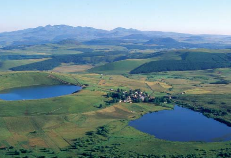
Sur fond de massif du Sancy, les estives de la Godivelle enserrant le lac d'en Haut, ancien cratère et le lac d'en Bas, d'origine glaciaire.