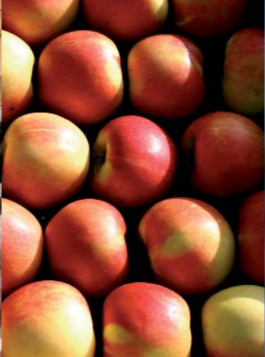
C'est autour de Champeix que l'on vient s'approvisionner en pommes.