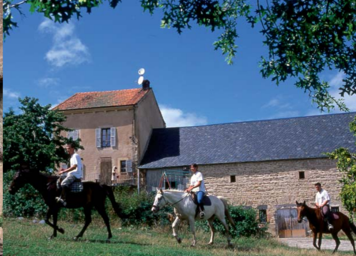
Sur les plateaux, l'habitat des hameaux se développe sans contrainte, les longues granges-étables s'alignent sur la maison d'habitation.