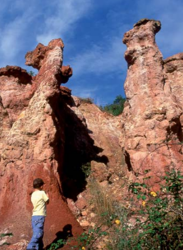
Sculptées par l'érosion, les cheminées de fées de Boudes doivent leur existence à leur "chapeau" de roche résistante.

A la périphérie des villages, les basses vallées des affluents de l'Allier portent la marque des cultures fruitières et de leur réseau d'irrigation quadrillant les anciens vergers. La vigne se plut sur les coteaux solaires jusqu'au 19 e siècle. Si celle-ci n'a survécu que sur certains terroirs, son héritage se traduit par une richesse patrimoniale omniprésente, celle des "cascades de terrasses" ou palhas , aménagées par les hommes. Les silhouettes emblématiques des tonnes de vignes et pigeonniers donnent le "la" d'une partition paysagère aux accents méridionaux.