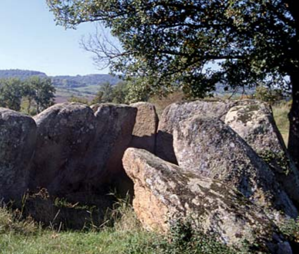
A Saint-Gervazy, le dolmen de l'Ustau du Loup est aussi appelé Allée des Fées.

L'activité batelière marchande sur l'Allier est contemporaine du développement du vignoble et des mines de Brassac, mais à partir de 1850, c'est le chemin de fer qui favorise l'émigration vers Clermont et Paris. Au début du siècle suivant le phénomène s'accroît avec la guerre de 14-18 et la fin du vignoble. Au cours du 20 e siècle, élans et reculs économiques alternent autour d'Issoire et de Brassac. Le pays s'engage aujourd'hui dans une nouvelle voie : accueillir les activités et les nouveaux résidents tout en valorisant le patrimoine culturel et les paysages.