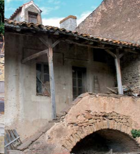
Cette maison de Boudes est une des rares à avoir conservé un perron extérieur protégé par un auvent ou courcour.