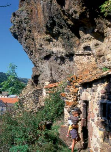
L'habitat troglodyte se niche dans les tufs de Perrier et du Cézallier.

La société rurale des siècles derniers a façonné une architecture très reconnaissable, aux matériaux puisés dans le sous-sol immédiat.