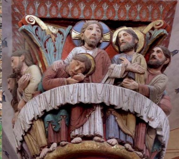
A l'abbatiale d'Issoire, les couleurs parachèvent la sculpture du chapiteau de la Cène.