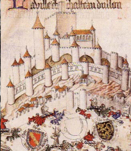
Une représentation très symbolique du château comtal et royal d'Usson figure dans l'Armorial de Revel, manuscrit datant du 15 e siècle.