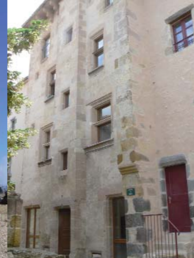
En pleine campagne, le quartier des forts de Sauvagnat se distingue par une architecture médiévale très soignée.