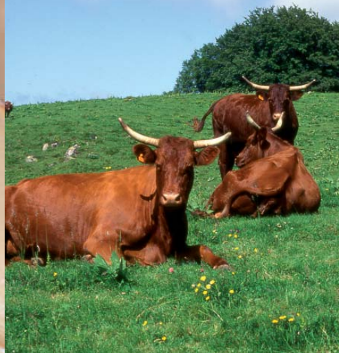
La qualité des pâtures d'altitude est une des clés de la saveur du saint-nectaire et de la viande salers.