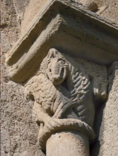
Le décor extérieur de l'église de Mailhat fait la part belle aux chapiteaux sculptés dans le grès, inspirés du bestiaire roman.