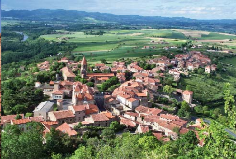
Surplombant le val d'Allier, le village de Nonette s'affiche méridional.